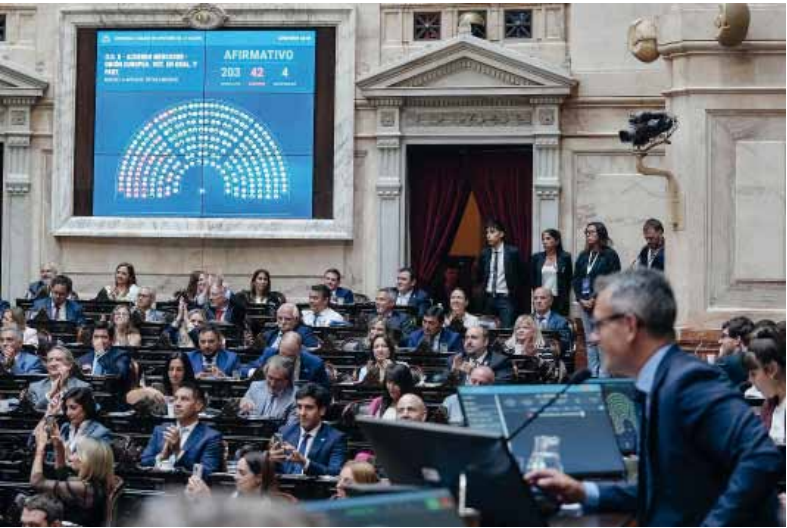
Al recinto. El Gobierno quiere que Diputados dé mañana su media sanción.

La difusión de la "letra chica" aceleró la reacción sindical. Desde la CGT y distintos gremios se multiplicaron los comunicados que denunciaron un eventual retroceso en materia de derechos laborales y alertaron sobre un "ataque a conquistas históricas". La presión pública sumó un nuevo frente de conflicto para el Ejecutivo.