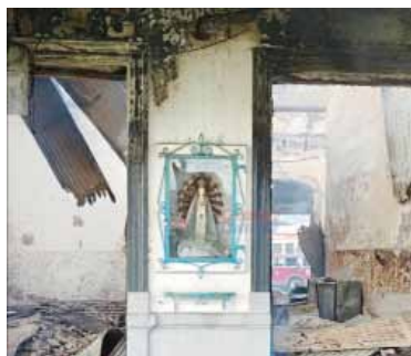
Incendio y milagro en Alberdi.

Ardió la estación de Alberdi, pero la Virgen quedó intacta