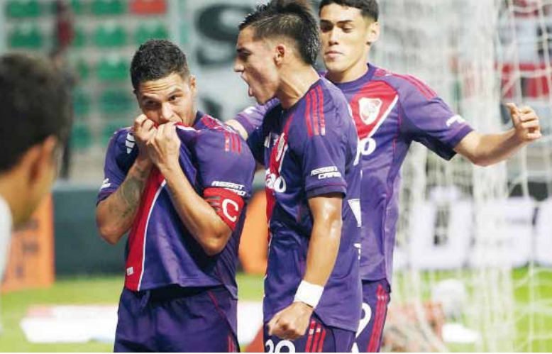
Siempre está. El colombiano le dio la victoria al “Millonario”.

En el arranque del complemento, Ciudad de Bolívar avisó