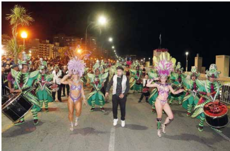
A la cabeza. Los destinos más elegidos fueron las ciudades con tradición de carnaval.

Además, hubo fuerte movimiento al exterior. Por ejemplo,