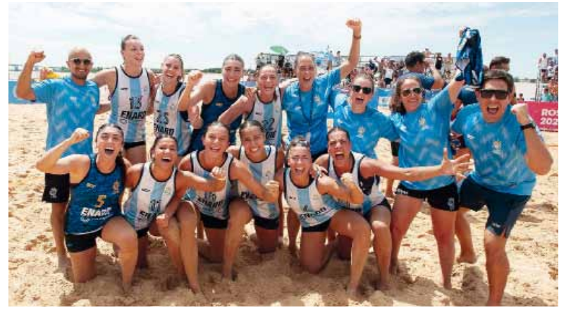
Campeonas. La Selección de beach handball gritó fuerte en Rosario.

Vencieron en la final a Brasil por 2-0 (17-16 y 19-16) y se clasificaron al Mundial de Croacia.